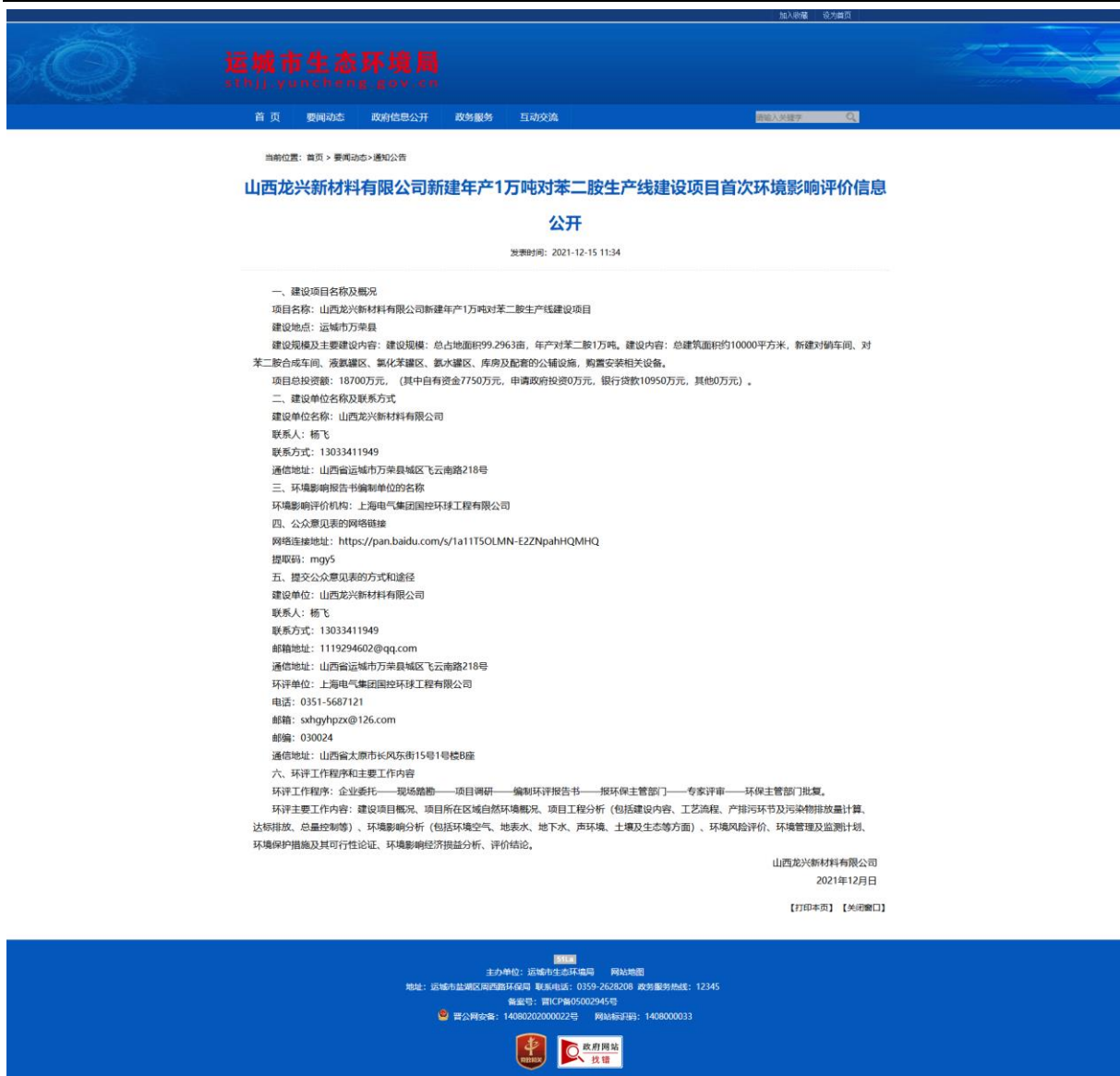
图 1 首次环境影响评价信息网上公示截图