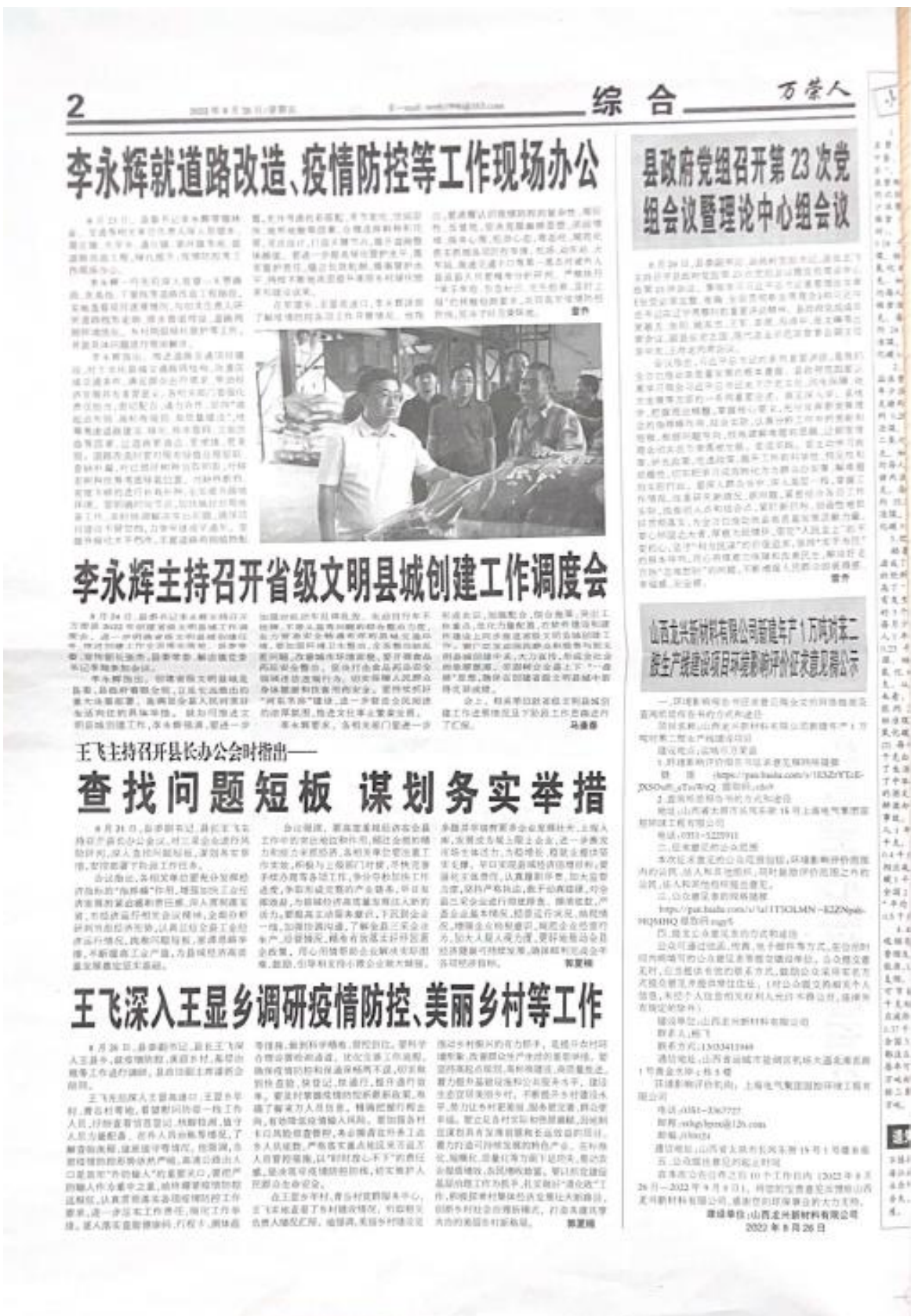
图 3a 第一次报纸信息公示