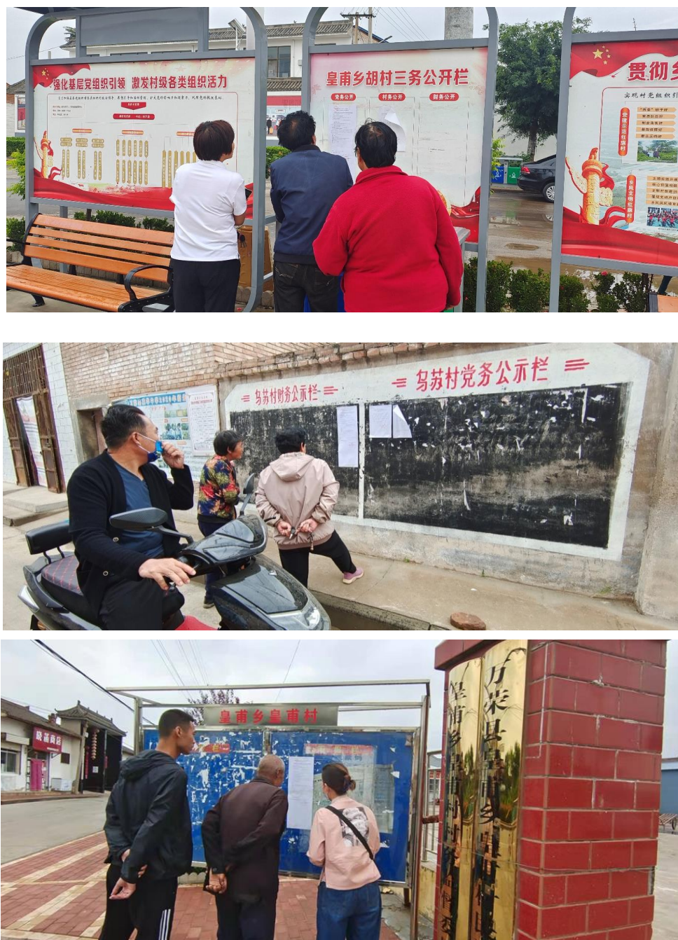
图 4 征求意见稿村庄张贴公示照片

山西龙兴新材料有限公司于 2022 年 8 月 26 日~2022 年 9 月 2 日在胡村、皇甫村、乌苏村等的公众易于知悉的地方张贴了征求意见稿公示。以上村庄均在本项目环境影响评价范围内，且具有代表性，符合《环境影响评价公众参与办法》的要求。张贴照片见图 4。