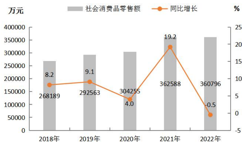
图 4 2018-2022 年社会消费品零售总额及其增长速度