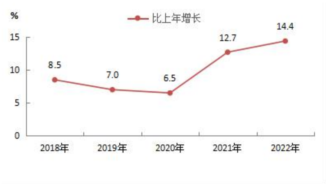
图 3 2018-2022 年规模以上工业增加值增长速度

全县规模以上工业中，传统行业增加值比上年增长 7.5 %，非传统行业增加值增长 62.9 %。分三大门类看，全年全县采矿业增加值比上年增长 32.0%，占规上工业增加值比重为 14.1%；制造业增加值增长 12.4%，占规上工业增加值比重为 82.9%；电力、热力、燃气及水生产和供应业增加值下降 4.0%，占规上工业增加值比重为 3.0%。分经济类型看，国有控股企业增加值比上年增长 10.8 %，私人控股企业增长 25.3 %。分企业规模看，大型企业工业增加值增长 5.8%，中型企业增长 1.0%，小型企业增长 62.0%。