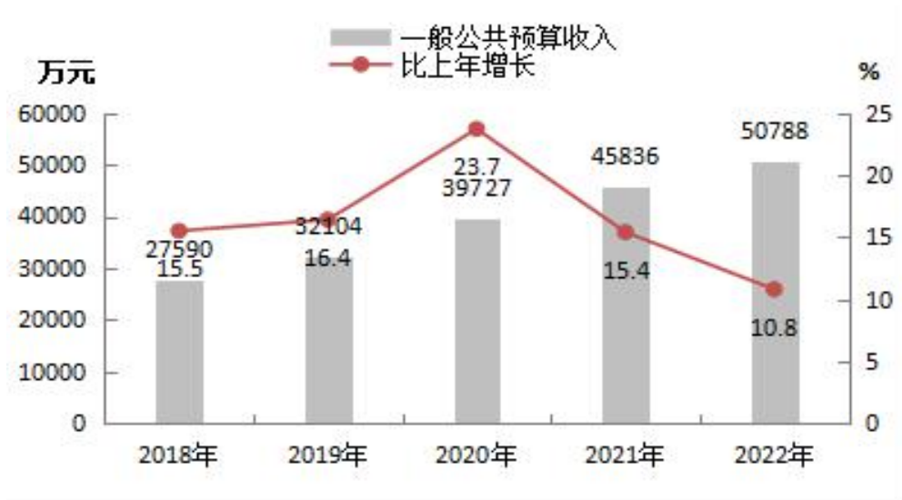
图 6 2018-2022 年一般公共预算收入及其增长速度

一般公共预算支出 242859 万元，比上年下降 16.9%。其中，民生支出 201474 万元，增长 16.2%。一般公共服务支出 24947 万元，增长 5.1%；公共安全支出 7344 万元，增长 26.7%；教育支出 47453 万元，增长 12.1%；社会保障和就业支出 47636 万元，增长 34.5%；卫生健康支出 21324 万元，增长 24.5%；农林水事务支出 39909 万元，增长 25.7%；节能环保支出 10855 万元，下降 0.9%；城乡社区事务支出 10478 万元，增长 15.1%；住房保障支出 4753 万元，下降 51.3%；文化旅游体育与传媒支出 4699 万元，下降 24.8%；科学技术支出 835 万元，增长 1.8%。