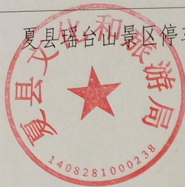
夏县瑶台山景区停车场提升改造工程平面布置图2/2